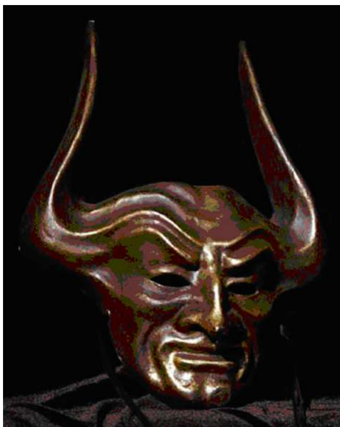
Un immagine antica ma, è solo un disegno

Sant'Agostino, nella sua opera "Nella città di Dio" , afferma che silfi e fauni, chiamati incubi , chiedevano e ottenevano il rapporto carnale; secondo i Galli, tali esseri, che si abbandonavano a queste pratiche, si chiamavano dusi o elfi (da notare l'analogia con gli elfi della tradizione folkloristica Scandinava, Tedesca e Inglese ). Anche gli autori del Malleus Maleficarum , benché questa sia un'opera medioevale, ci parlano di questi incubi e del loro continuo insediarsi nelle case durante la notte per appagare i loro desideri, sostenendo tra l'altro che la copula tra Demoni/Diavolo e donne fosse sempre dolorosa in ricorrenze festive come Natale e Pasqua; Negli altri casi, la copula procurava piacere alle donne. Ma, così facendo, offendevano Dio. Molto controversa risulta essere a questo punto la natura di questi demoni, visto che vi si danno vari nomi e visto che tutti, come Satana, si abbandonano a queste malefiche e devianti pratiche.