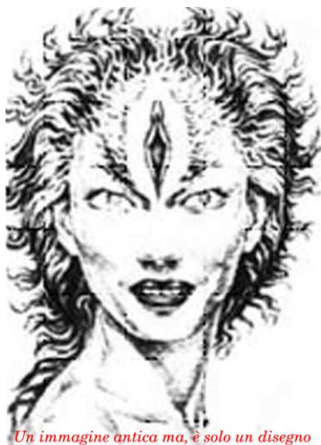
Un'immagine antica ma, è solo un disegno

Dalla tradizione javhista deriva un passo celebre di Genesi (VI:1), di cui si deve tenere conto: «Quando gli uomini cominciarono a moltiplicarsi sulla terra e nacquero loro figlie, i figli di Dio videro che le figlie degli uomini erano belle e ne presero per mogli quante ne vollero». Dall'unione tra questi angeli concupiscenti e le figlie degli uomini viene poi detto che nacquero i Giganti . Questo mito verrà poi ripreso nel Libro di Enoch e diventerà una delle spiegazioni sull'origine del diavolo. Un altro "pezzo" della costruzione del Diavolo lo offre - inconsapevolmente - Isaia, nel versetto 34, dove si parla della condanna di Edom : «Gatti selvatici si incontreranno con iene, satiri si chiameranno l'un l'altro; vi faranno sosta anche le civette e vi troveranno tranquilla dimora».